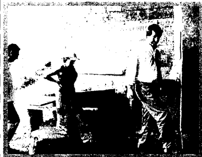
Deze suikerfabriek van een kleine boerencoöperatie in Puriscal is mede gefinancierd met geld van Nederlandse ontwikkelingsamenwerking. Rechts: Van Bonzel. Midden: Zijn echtgenote

Het Koninkrijk der Nederlanden heeft over de hele wereld vertegenwoordigingen: ambassades, consulaten en permanente vertegenwoordigingen bij internationale organisaties. De posten staan onder leiding van ambassadeurs en consuls-generaal. Zij vertellen u graag over hun werk in de landen waar ze geplaatst zijn. Omdat het buitenlands beleid een zaak is voor alle Nederlanders, is Rentan Ambassador bedoeld voor iedereen – van sportvereniging tot zakelijke netwerkclub, van studentenvereniging tot vrijwilligersorganisatie – die geïnteresseerd is in het buitenland en graag eens een Nederlandse ambassadeur aan de tand wil voelen over zijn of haar ervaringen. Zie www.rentanambassador.nl