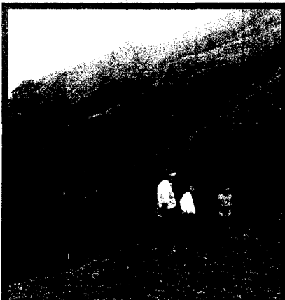
COOPEPURISCAL helpt kleine boeren via herbebossing het sterk geërodeerd land weer vruchtbaar te maken.

Nederlands beleid is in grote mate verbonden met Europees beleid. “Nederland kan in Brussel van zich doen horen, zodat de EU gewenste zaken doorvoert. Dat lukt ons ook vaak”, meent Van Bonzel. “Het is spijtig dat de EU bananen uit Midden-Amerika tegenhoudt met het argument dat we de kleine boeren op de Canarische Eilanden moeten beschermen. Die zijn al zwaar gesubsidieerd. In Midden-Amerika zijn ook veel kleine producenten actief, met name van ecologische bananen en ananas. Soms dankzij Nederlandse ontwikkelingshulp. Wij moeten hen nu de kans geven hun producten af te zetten op de Europese markt.” Ook ten aanzien van de associatieverdragen kan Nederland een verschil maken. “Tussen de Europese Unie en Latijns-Amerika bestaat een belangengemeenschap: beide continenten kennen een gemengde economie. Dat is iets anders dan in de VS, China en Japan. Vrijhandelsverdragen met deze landen zijn puur gericht op vrijhandel en niets anders. Terwijl de EU inzet op drie pijlers: politieke dialoog, ontwikkelingssamenwerking en vrijhandel. Dat past goed in Latijns-Amerika, waar ze evenmin een volledige vrijheid voor het bedrijfsleven wensen. Ook daar leeft de wens naar vrije vakbonden, een sociaal vangnet van uitkeringen en pensioenen en een actieve rol van de overheid. Nederland kan zich inzetten de samenhang tussen deze drie pijlers te behouden.”